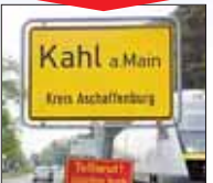
1. Kahl: Lärmpegel sinkt von 45 auf 39 db