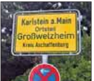
3. Karlstein-Großwelzheim: Lärmpegel sinkt von 42 auf 37 db