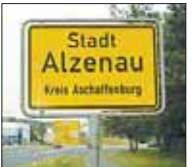
2. Alzenau: Lärmpegel sinkt von 40 auf 35 db